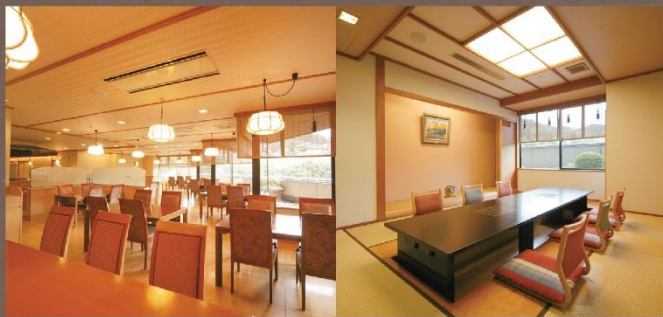
■3F 料理茶屋 燕来